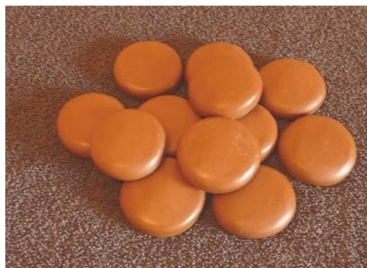
Kit 12 pierres froides tarif indicatif 25€

Afin de pouvoir mettre en pratique ce que vous avez appris à l’issue de certaines formations, il vous appartiendra d’acquérir du matériel spécifique détaillé ci-dessous. Ce matériel pourra être acquis sur place le jour de la formation.